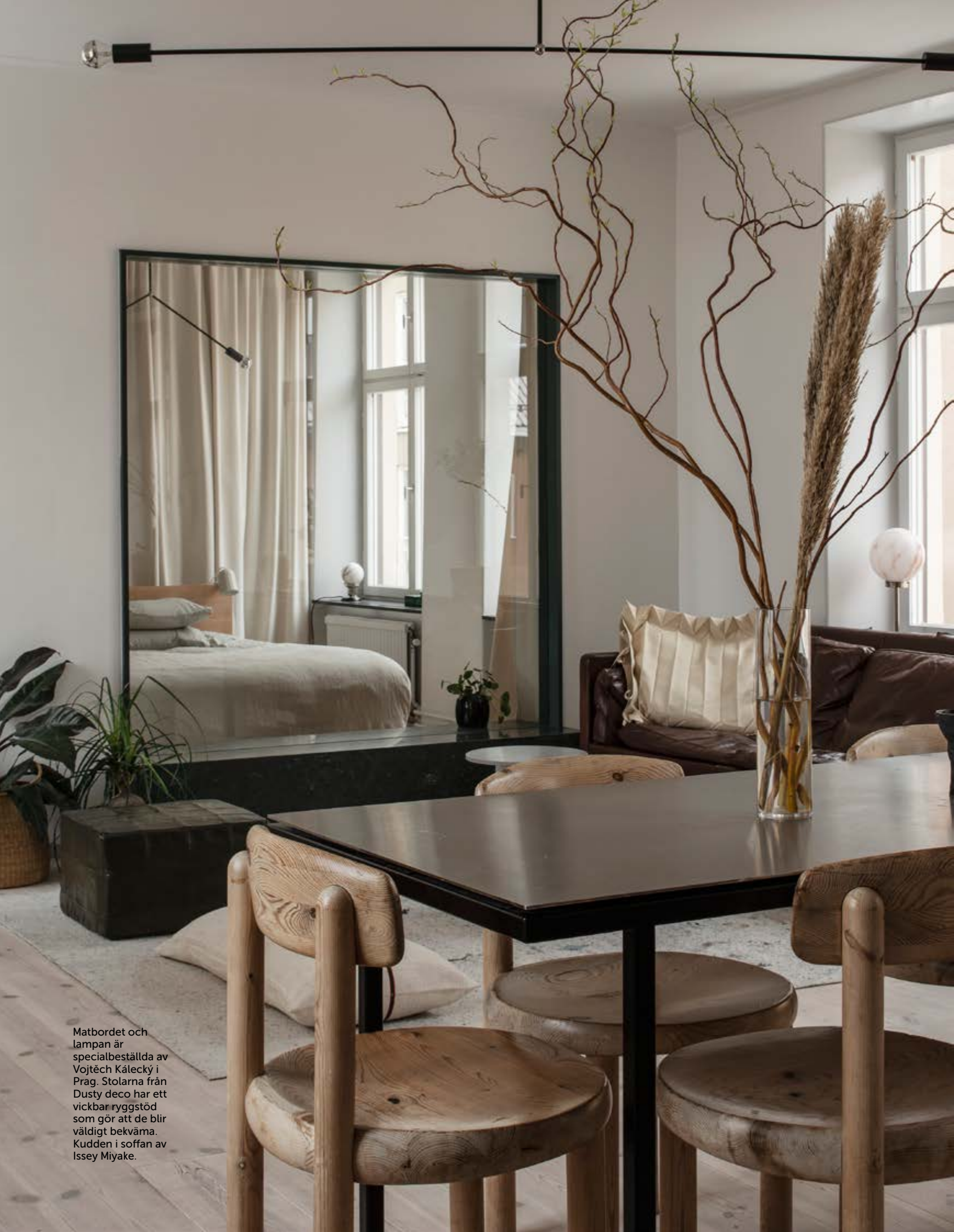
Matbordet och lampan är specialbeställda av Vojtěch Kálecký i Prag. Stolarna från Dusty deco har ett vickbar ryggstöd som gör att de blir väldigt bekväma. Kudden i soffan av Issey Miyake.